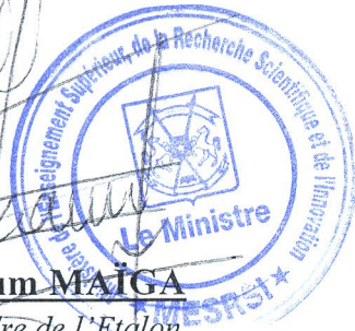
Pr Alkassoum MAÏGA Officier de l'Ordre de l'Étalon Commandeur de l'OIPA/CAMES

Le Ministre de l'Enseignement Supérieur, de la Recherche Scientifique et de l'Innovation